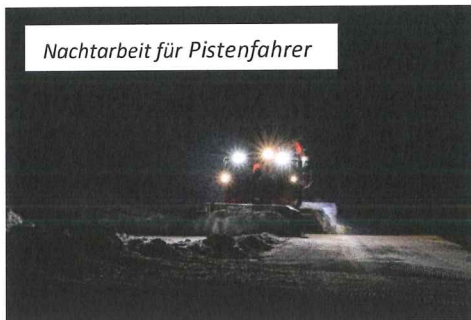
Nachtarbeit für Pistenfahrer

profitierten alle Wintersportler. Termingerecht war am 16. Dezember Saisonstart auf allen Anlagen.