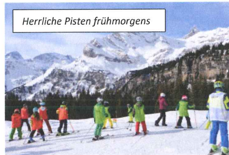
Herrliche Pisten frühmorgens

Über die Feiertage im Dezember / Januar konnten wir Dank guten Schneeverhältnissen den Gästen ideale Pisten anbieten, die auch rege benützt wurden. Sonnige Wochenenden nur gestört von einigen Sturmtagen erlebten unsere Gäste im Januar.