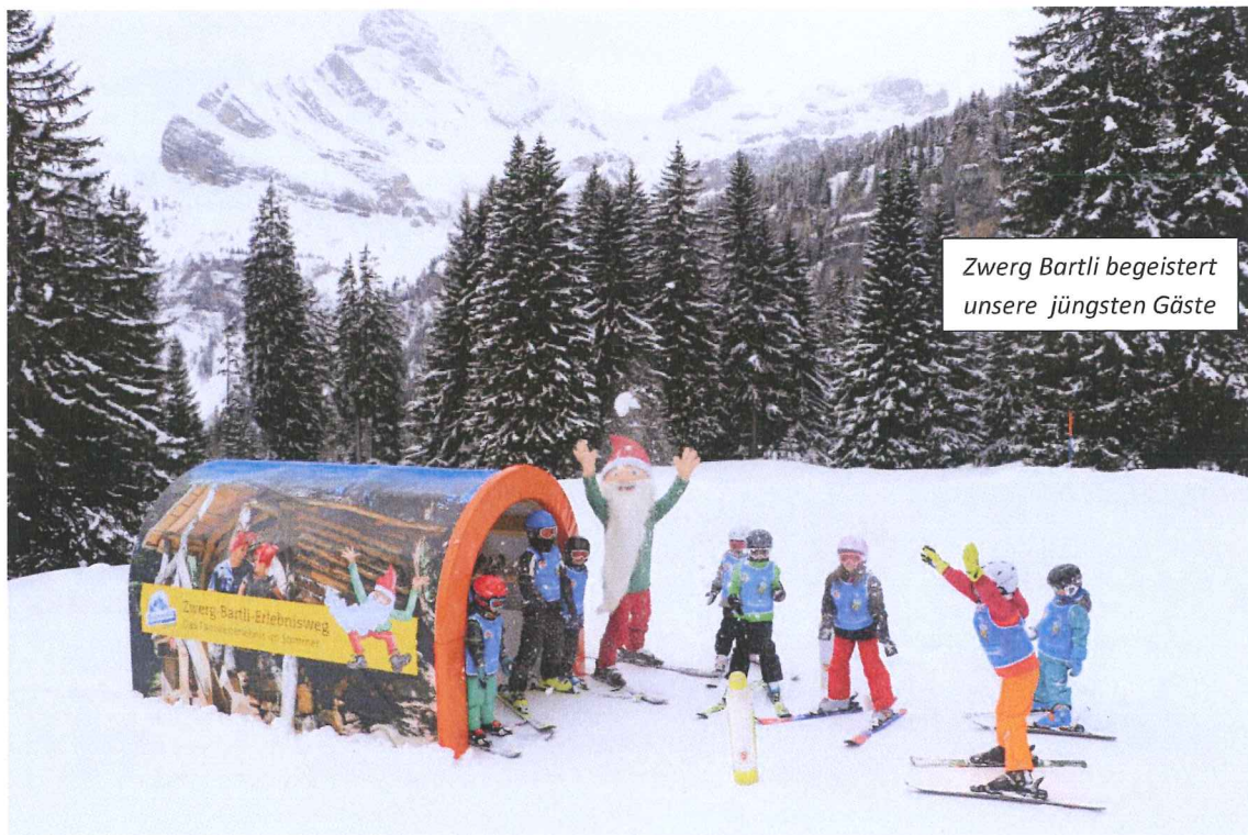
Zwerg Bartli begeistert unsere jüngsten Gäste