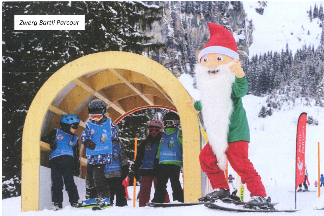
Zwerg Bartli Parcour

Der neue „Zwerg-Bartli Parcour“, wurde im Februar in Zusammenarbeit mit der BKT eingerichtet, welcher von der Schneesportschule und den Kindern rege benützt wird. An dieser Stelle sei den Partnern (Fridliholz) und dem Pistenteam für das Aufstellen und der Installationen der Hindernisse und Tunnel gedankt.