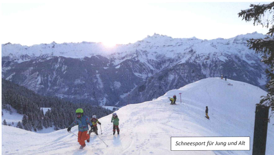
Schneesport für Jung und Alt

Der Winter 2017 / 2018 brachte eine Verkehrsumsatzsteigerung von gut 10 % gegenüber den unbefriedigenden letzten zwei Saison's.